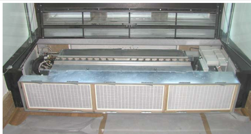
Bild 7: Einbau des dezentralen Klimagerätes QVM in eine Brüstungsnische / Koordination mit MSR / Sicherheitstechnik etc

Die Integration der Klimageräte in eine 300-Jahre alte Bausubstanz erfordert eine flexible Anpassung an die baulichen Gegebenheiten, die sich von einer Gebäudeachse zur nächsten stark ändern können, siehe Bild 7. Dies wird durch einen modularen Geräteaufbau und eine flexible Fertigung stark vereinfacht, so dass für unterschiedliche Brüstungsgeometrien eine geräteseitige Anpassung vorgenommen werden. Ebenso konnten Sondergeräte für den Bodeneinbau und Umluftgeräte für den Wandeinbau angepasst werden.